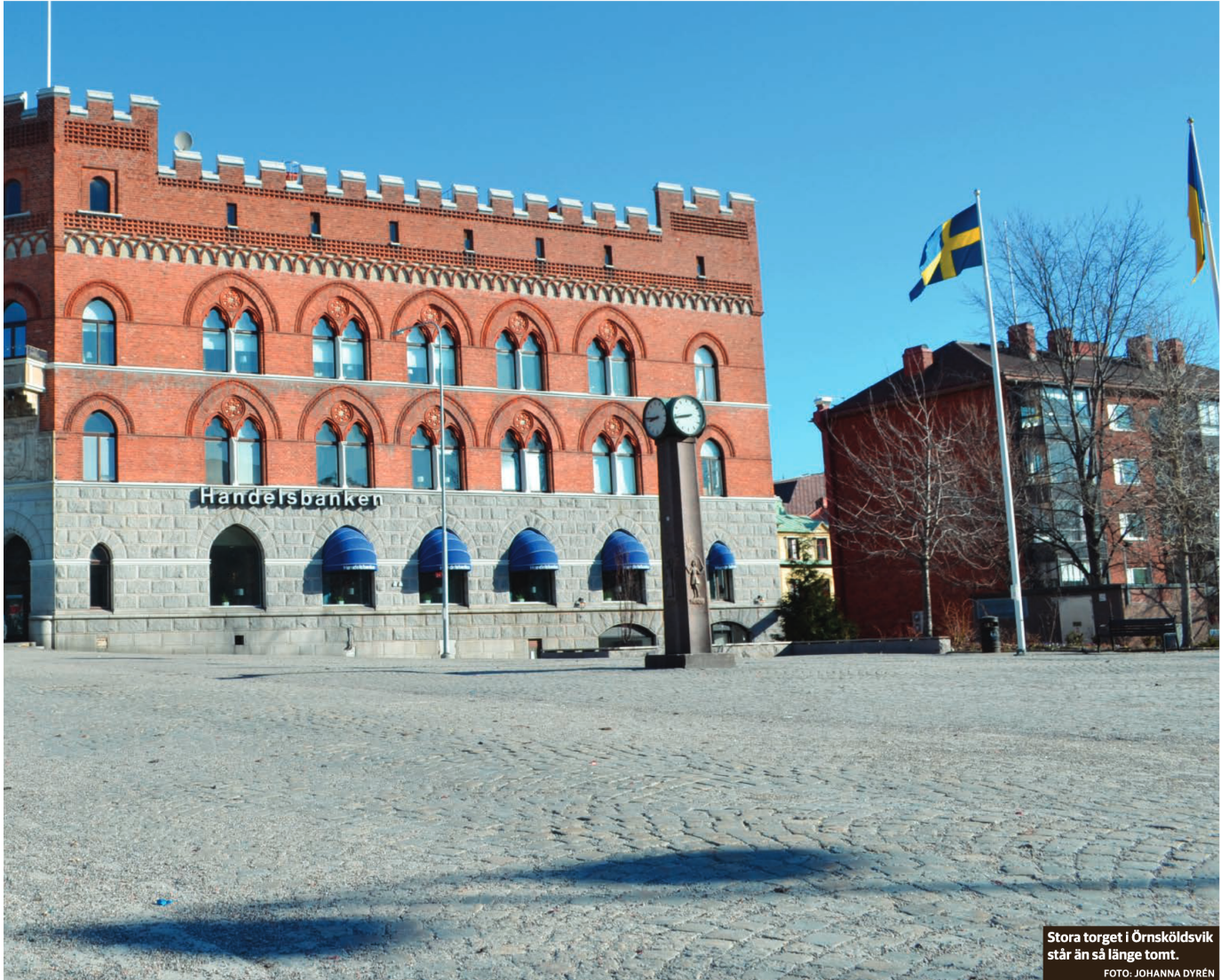
Stora torget i Örnsköldsvik står än så länge tomt.